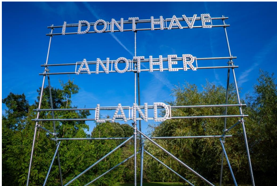
Nathan Coley, I Don't Have Another Land , 2022, lightbulbs, aluminium and scaffolding. Courtesy of the artist and The Page Gallery, Photo: Chris Radomski