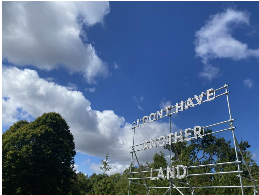
Nathan Coley, I Don't Have Another Land, 2022, lightbulbs, aluminium and scaffolding.